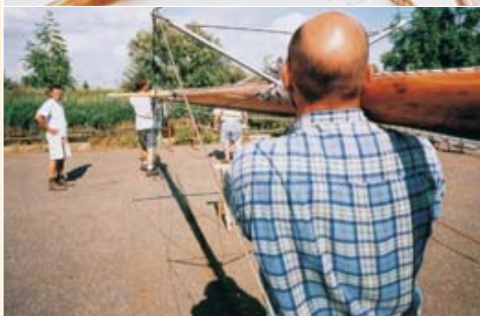
1 Shoppen! Vallen, blokken, sluitings - nog even en we kunnen zeilen...